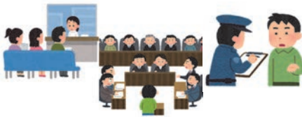
病院・警察・裁判所等への付添い