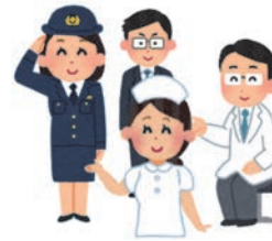
関係機関との連携