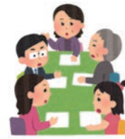
自助グループへの 支援