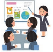
被害者支援員の 養成・研修