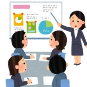
被害者支援員の養成・研修