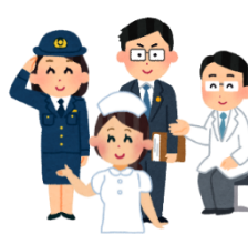
関係機関との連携