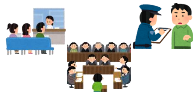
病院・警察・裁判所への付添