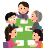
自助グループへの支援